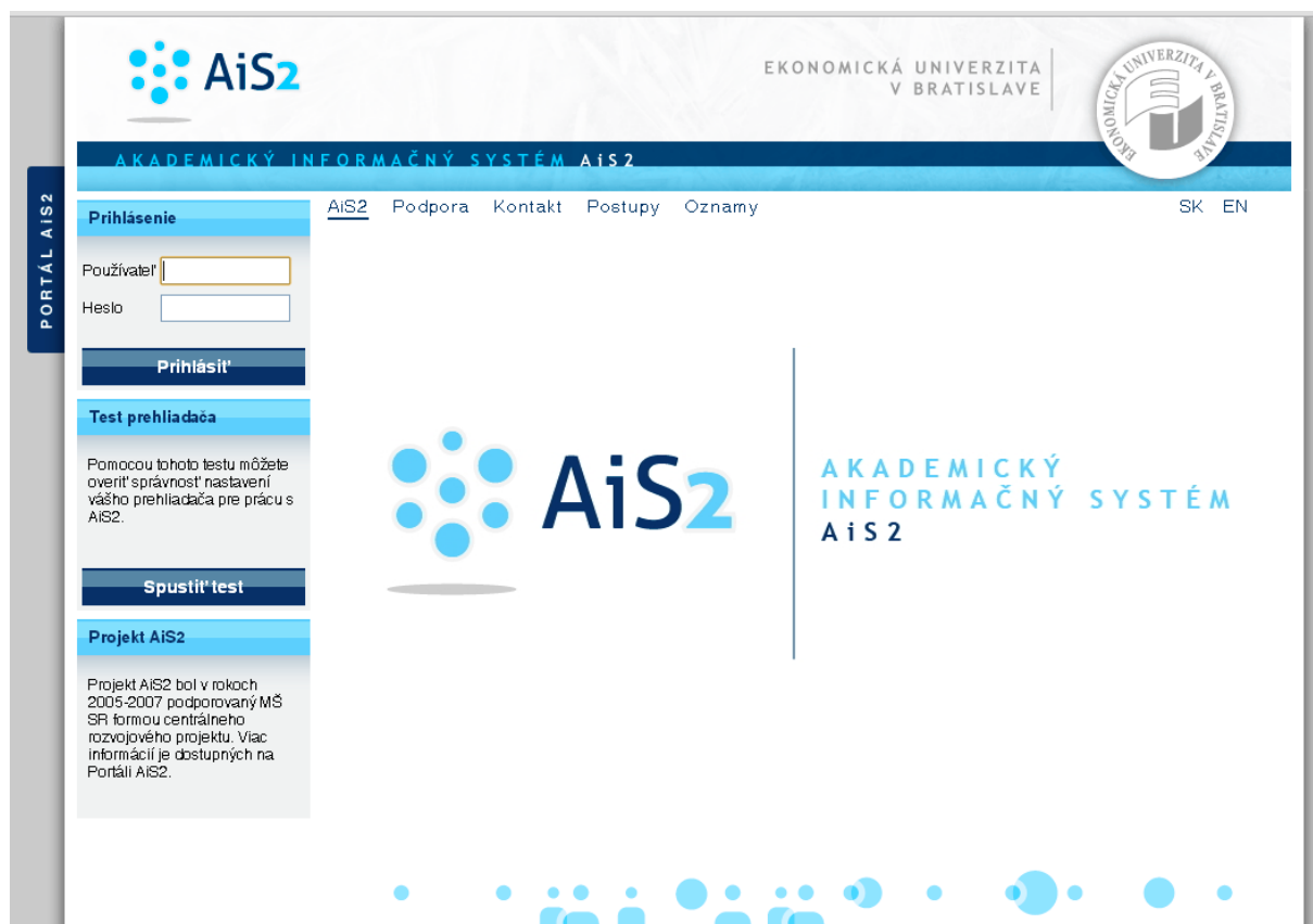
Obr. 1 Portál AIS2

Používateľský prístup pre prvákov do AIS2 - novoprijatí študenti budú mať vytvorené používateľské konto v AISe po zriadení študentskej karty (koncom septembra).